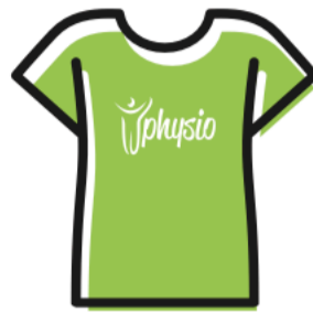
T-SHIRT COTONE € 15.00