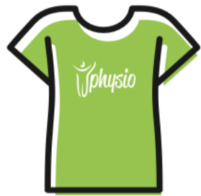
T-SHIRT TECNICA € 20.00

ABBIGLIAMENTO, MERCHANDISING E BUONI REGALO PER OGNI OCCASIONE: CONTATTA IL NOSTRO STAFF E REGALA (O REGALATI) UN PENSIERO DI BENESSERE!