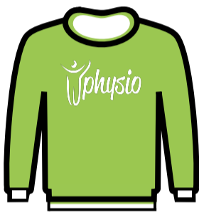
FELPA GARZATA € 35.00