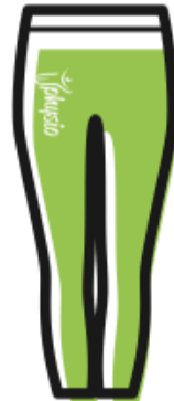
LEGGINGS € 30.00