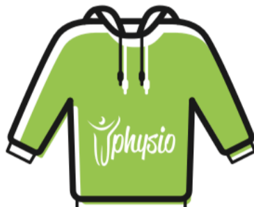
FELPA CON CAPPuccio € 40.00