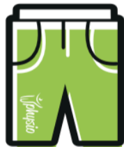
PANTALONCINI CON TASCHE € 20.00