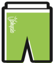
PANTALONCINI € 20.00