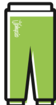
PANTALONE LUNGO TUTA € 35.00