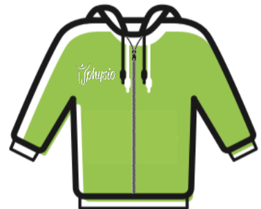
FELPA CON ZIP E CAPPuccio € 40.00