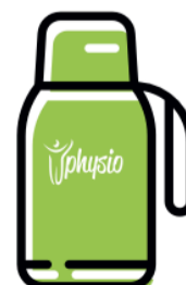
BORRACCIA € 15.00